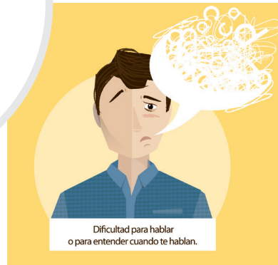
Dificultad para hablar o para entender cuando te hablan.

1 de cada 5 personas sufrirá un ictus en España