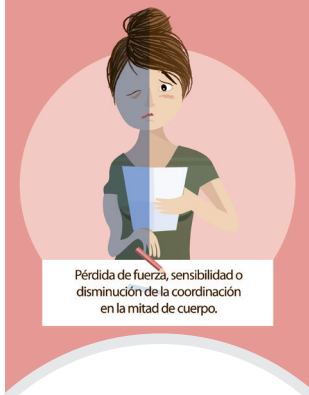
Pérdida de fuerza, sensibilidad o disminución de la coordinación en la mitad de cuerpo.

Reconocer sus síntomas puede ayudar a salvar vidas