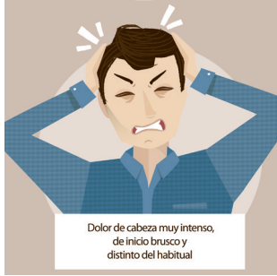
Dolor de cabeza muy intenso, de inicio brusco y distinto del habitual