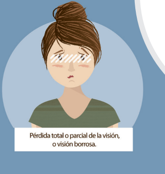
Pérdida total o parcial de la visión, o visión borrosa.

1 de cada 5 personas sufrirá un ictus en España